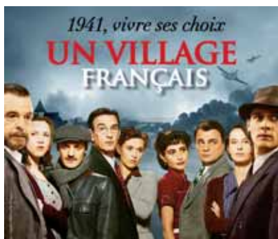
Téléto a réalisé la post-production de la 4 e saison de la série « Un Village Français » diffusée sur France 3