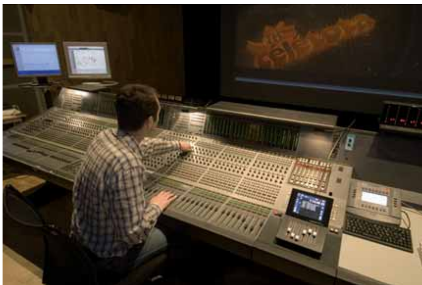
Téléto se positionne comme intégrateur des solutions techniques les plus récentes

Filiale d'Eclair Group, Téléto, créée en 1972, se positionne comme un intégrateur des solutions technologiques les plus récentes et mise sur sa capacité à accompagner tous les types de projets audiovisuels, en s'appuyant sur ses départements distribution, adaptation (sous-titrage, doublage, audio description, sourds et malentendants) et son data center, au service des productions (services en ligne avec solution de numérisation et de gestion personnalisée des contenus). Aux côtés des Laboratoires Eclair, acteur centenaire du cinéma européen, Téléto propose ainsi des prestations autour de 4 pôles d'activités : la production (post-production photochimique et numérique de longs et courts métrages, fictions TV, publicités, documentaires); la distribution (physique ou dématérialisée,