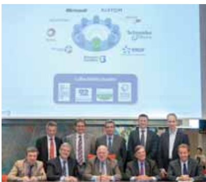
Les premiers résultats d'IssyGrid seront présentés d'ici la fin de l'année.

Dans un contexte énergétique de plus en plus tendu et complexe (énergies renouvelables insuffisamment développées en France, tension sur les coûts du pétrole, arrivée des véhicules électriques), IssyGrid a l'ambition d'apporter une réponse locale aux défis énergétiques et environnementaux des prochaines années. ■