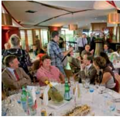
Les membres du BossClub ont pu dialoguer avec Frédéric Lefebvre, secrétaire d'état.