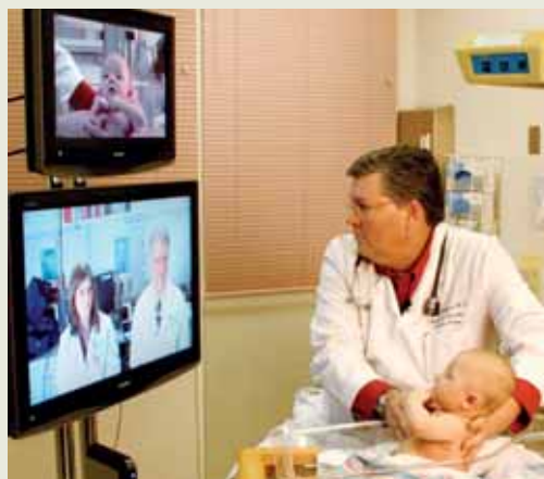
Bientôt des consultations virtuelles avec les médecins ?