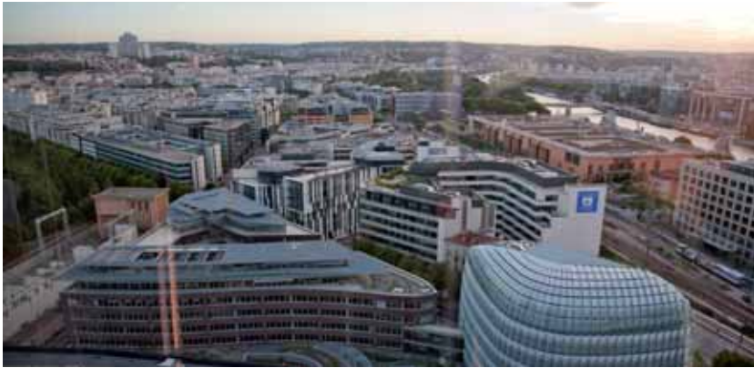
Le quartier d'affaires Seine Ouest à Issy.

Un consortium (GIE) regroupant Alstom, Bouygues Immobilier, Bouygues Telecom, ERDF, ETDF, Microsoft, Schneider Electric, Steria et Total vient d'être constitué pour faire du quartier d'affaires Seine Ouest, à Issy-les-Moulineaux, le premier « smartgrid » français.