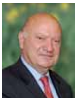
André Santini Ancien Ministre Député des Hauts-de-Seine Président de la Communauté d'Agglomération Arc de Seine Maire d'Issy-les-Moulineaux