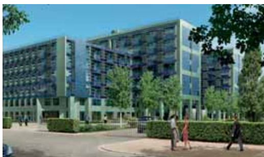
Grand Paris Seine Ouest sera une référence en matière de bureaux Très Haute Qualité Environnementale. Ici, Green Office à Meudon.

Grand Paris Seine Ouest est au centre du paysage audiovisuel français : TF1, France 3 Ile-de-France, Canal +, France 5, Arte, Eurosport, France 24, BFM, Gulli... sont installés sur le territoire, aux côtés de groupes comme Marie Claire, Young and Rubicam, l'Equipe ou TBWA. Les fleurons des Technologies de l'Information et de la Communication s'y distinguent : Microsoft, France Telecom R&D, HP, Cisco Systems, Bouygues Telecom, Intel, Gemalto, SFR.