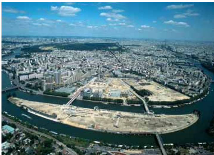
Traversé de part et d'autre par la Seine, le territoire né de la fusion est source de projets ambitieux, à commencer par l'Île Seguin.