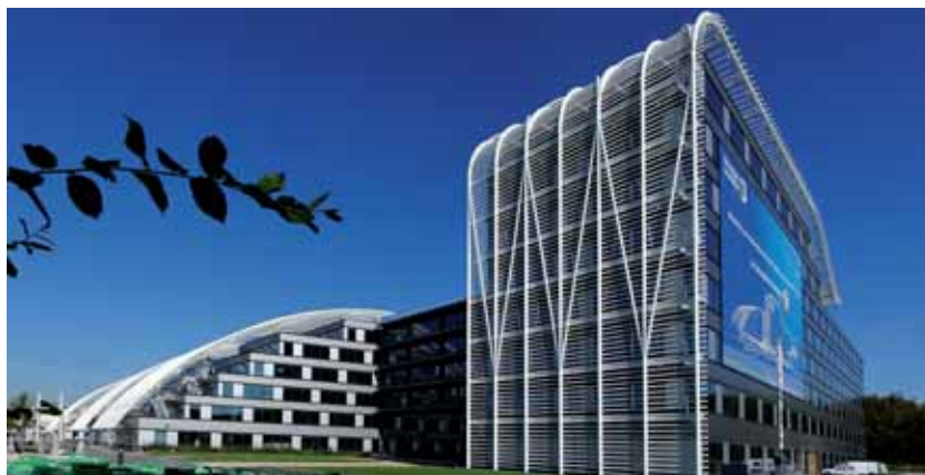
Le Technopôle a été inauguré le 15 décembre dernier (lire en page 12).

Le Technopôle dispose également d'un centre nerveux fonctionnant 24h/24, pouvant être dépanné en temps zéro en cas de coupure générale, d'un immeuble de bureaux accueillant jusqu'à 3 600 postes de travail, d'un auditorium de 150 places, d'un espace de 21 salles de réunions... ■