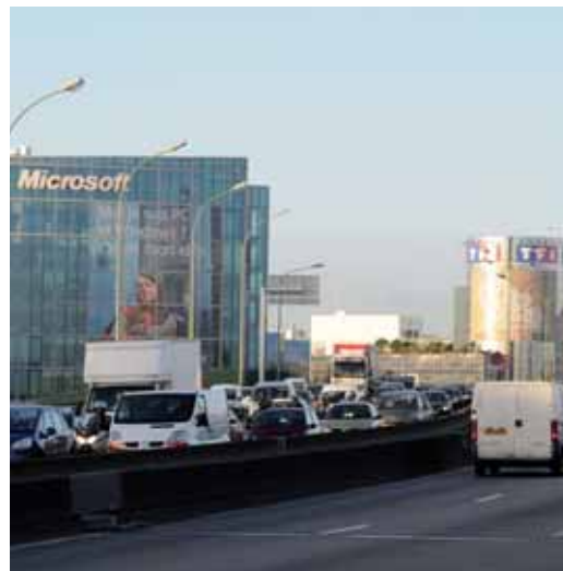
Deux secteurs phares : les médias et les TIC.

particulièrement bien desservi par les transports en commun (30 gares et stations de train, de métro et de tramway). 20 000 sociétés sont réparties dans tous les secteurs d'activités, avec une prédominance de la communication et du High Tech. Avec environ 70% d'entreprises de moins de 10 salariés, la nouvelle Communauté d'Agglomération constitue un espace économique exceptionnel fondé sur l'esprit d'entreprendre.