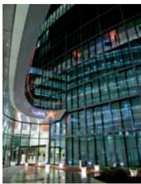
Siège de Lundbeck France.

L'industrie pharmaceutique est un secteur de plus en plus complexe et risqué au niveau de la R&D, et notre approche est de dédier le maximum de nos ressources pour développer le plus vite possible des médicaments dans tous les domaines de la neurologie et de la psychiatrie. ■