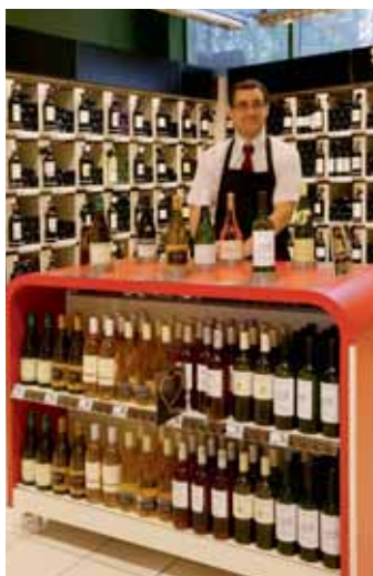
La cave de 1 300 références est animée par un sommelier dédié.

Au terme d'un ambitieux programme de modernisation et d'agrandissement, Auchan Issy-les-Moulineaux a inventé un nouveau magasin, au plus près des attentes et des besoins des salariés et des entreprises.