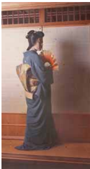
Une geisha, Kyôto, 1912. Autochrome de Stéphane Passet.