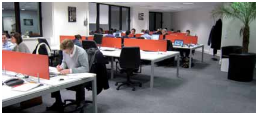
Les locaux d'Openbridge à Boulogne-Billancourt.

Les dirigeants de l'entreprise sont conscients qu'il leur faut convaincre