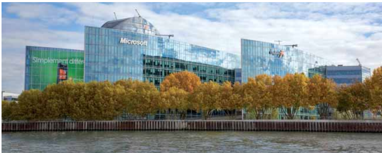
Le géant américain de l'informatique Microsoft a installé son siège Europe à Issy-les-Moulineaux en octobre 2009.

Une autre partie de la réponse vient de la qualité de l'accueil offerte par les élus locaux. Leur implication personnelle et leur activité démontrent qu'il est possible pour un acteur public de faciliter la mise en réseaux en offrant son territoire comme terrain d'expérimentation.