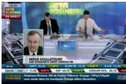
Premières images de BFM Business.

Lancée le 22 novembre dernier par le groupe issu de NextRadioTV, BFM Business propose des programmes communs avec BFM Radio.