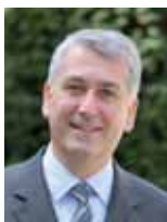
Pierre-Christophe Baguet Président de la Communauté d'Agglomération Grand Paris Seine Ouest Député des Hauts-de-Seine Maire de Boulogne-Billancourt